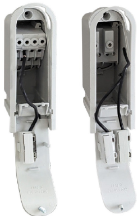
MORSETTIERA da PALO Pb Free – Feritoia 38x132

Con questa evoluzione il Gruppo DKC conferma un approccio che integra innovazione tecnica e responsabilità ambientale : progettazione interna, produzione Made in Italy e controllo diretto della filiera si traducono in soluzioni affidabili, conformi e già orientate al futuro del settore. Un impegno concreto che posiziona DKC non solo come fornitore, ma come partner capace di anticipare il cambiamento e accompagnare il mercato verso infrastrutture elettriche più efficienti, sicure e sostenibili.