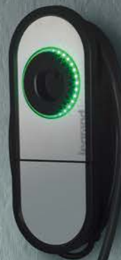
Art. 057012 Wallbox GreenUP ONE fino a 7,4 kW con cavo integrato