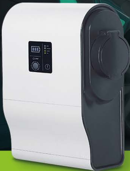
Art. 058001 Wallbox GreenUP Premium fino a 7,4 kW